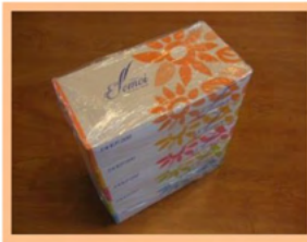
② ティッシュペーパー