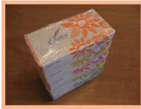
② ティッシュペーパー